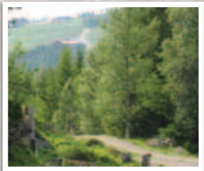
Fra Djupvass-seteren mot Nesset.

Du starter ved krysset til Nesset og sykler langs «Nesseveien» en liten bit. Der fra svinger du opp en skogsbilvei til venstre. Det er stort sett grusvei og skoglendt hele veien. På tur ned mot Nesset kommer du ned en bratt bakke langs et grustak. Dette er fin treningsløype for deg som vil ta deg en treningstur opp mot Djuvatnet, som har mange spennende fiskeplasser. 15 km.