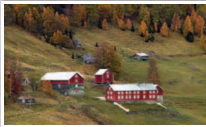
Oppgården i Kvelia.