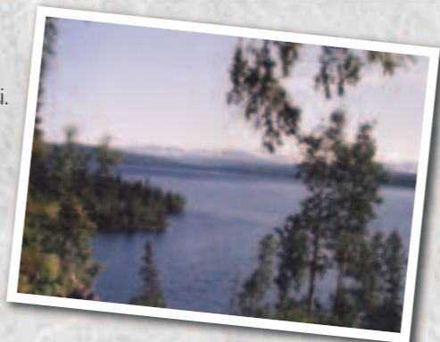
Laksjøen fra Seterberget.

7 km med oljegrus og resten er grusvei. Variert terreng med både lette og bratte parti. Ruten gir muligheter til oppsvarasjon av både storvilt og småvilt. Informasjonstavle om Fiskeveien og gapahuk på P-bakken ved Skjelbredbrua. 15 km.